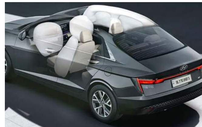
Asistente de arranque en pendiente (HAC)