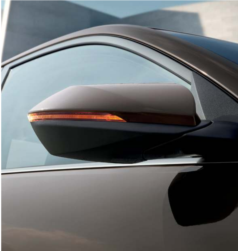
Espejos retrovisores exteriores e intermitentes