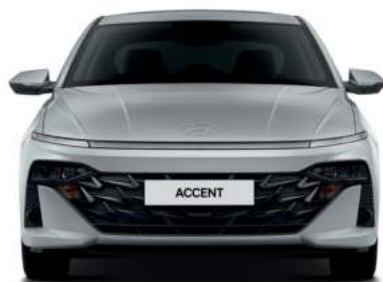
Ancho general 1,765