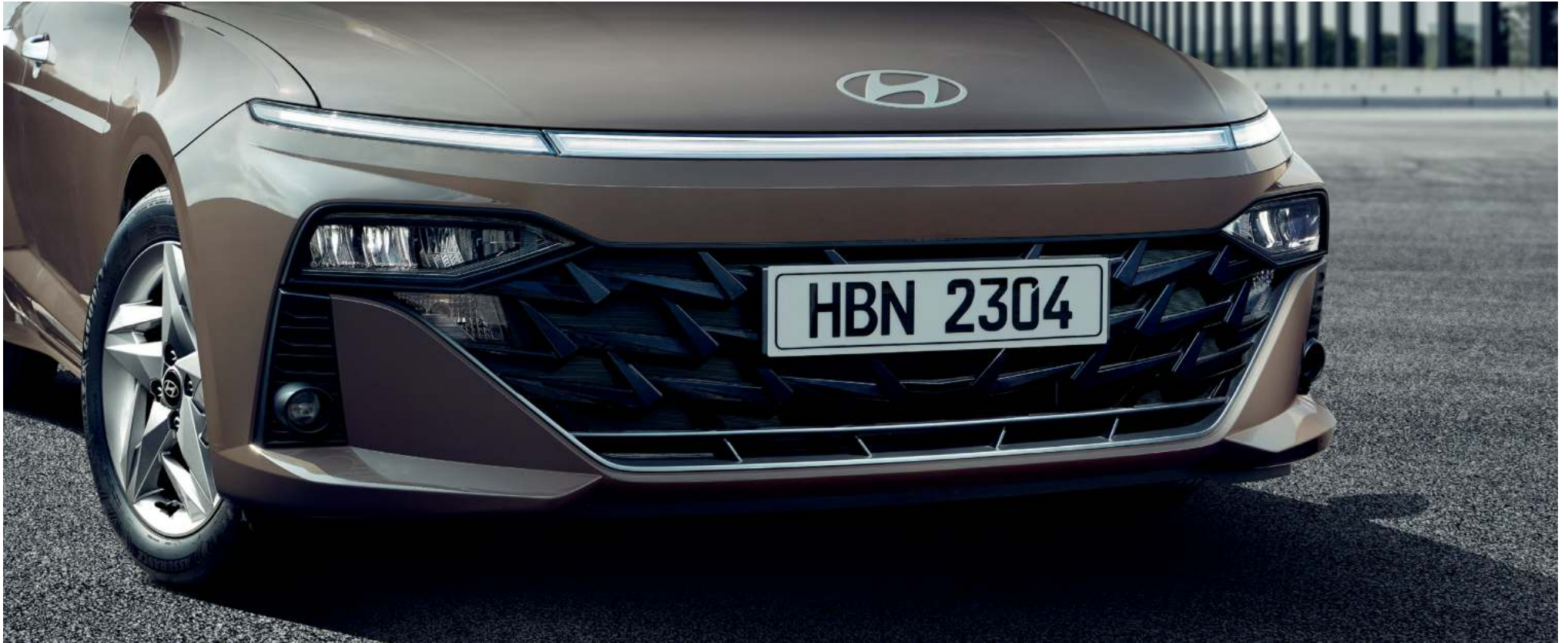
Parrilla paramétrica cromada negra / Neblineros delanteros / Faros halógenos de proyección / Luces diurnas

La parrilla paramétrica cromada en negro y las llamativas llantas de aleación añaden los perfectos toques finales.