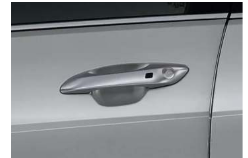
Manijas color carrocería