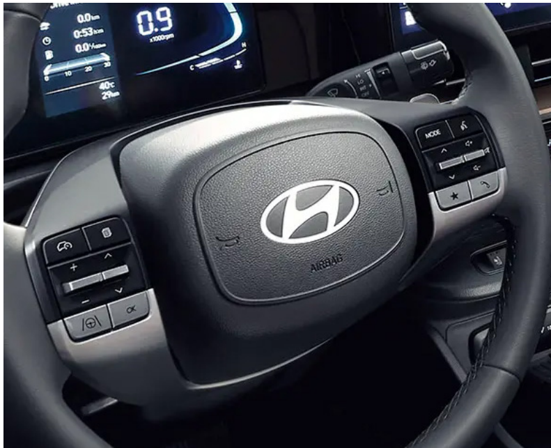
Control de audio al volante / Bluetooth con reconocimiento de voz