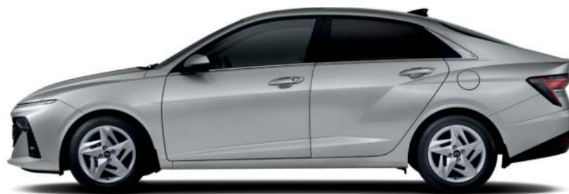
Distancia entre ejes 2,670 Longitud general 4,535