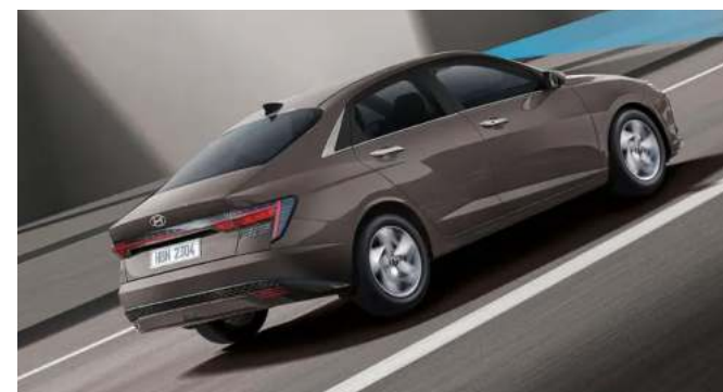
6 Airbags (conductor y pasajero + tórax y pelvis + cortina)