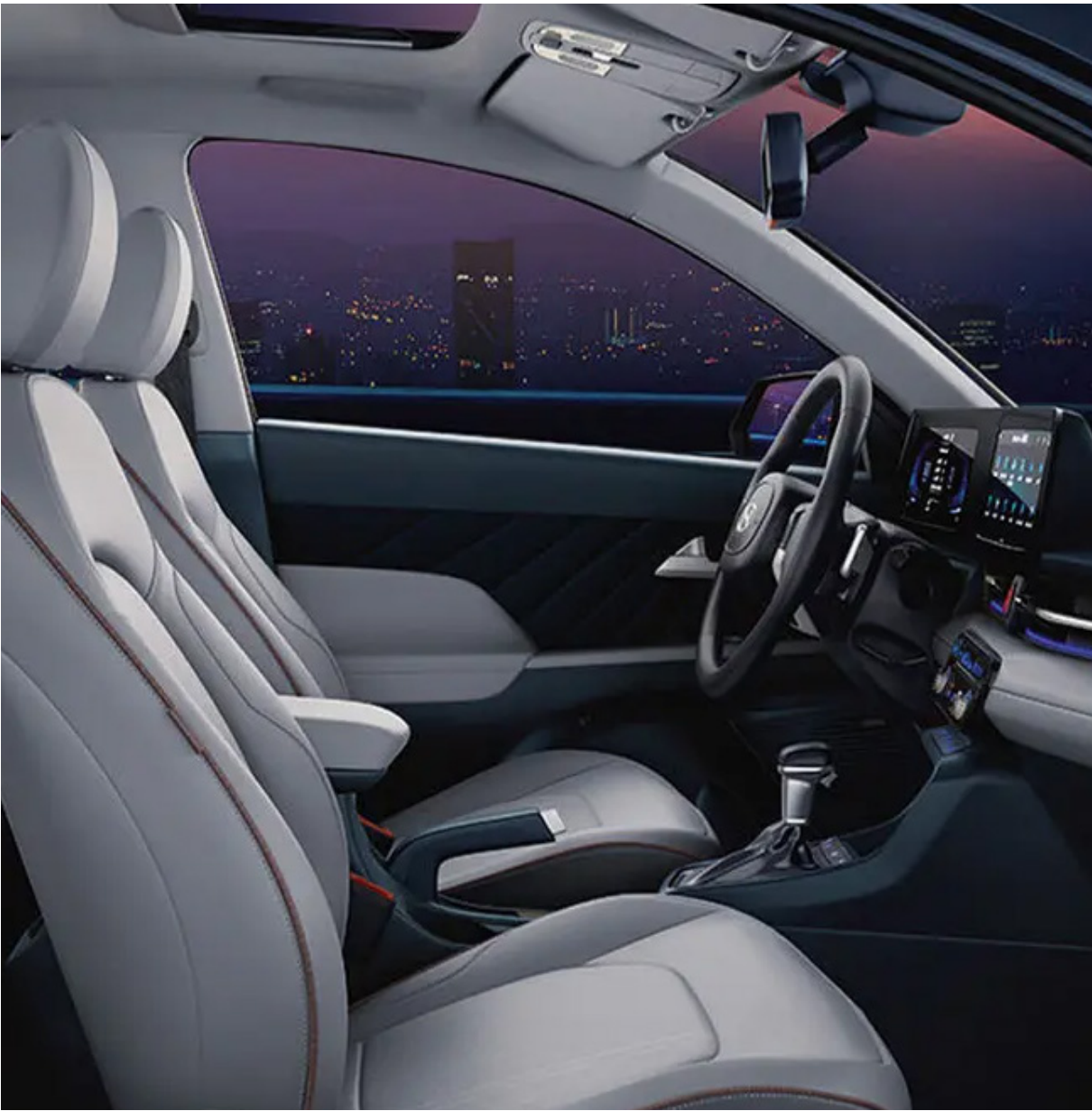
Espacio, un paso al futuro .