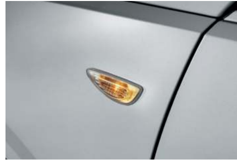
Intermitente de guardabarros (tipo bombilla, STD)