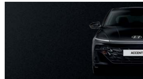
Negro Abismo Perlado_A2B