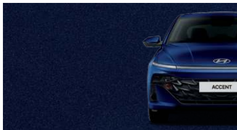
Azul Trueno Metálico_NB5