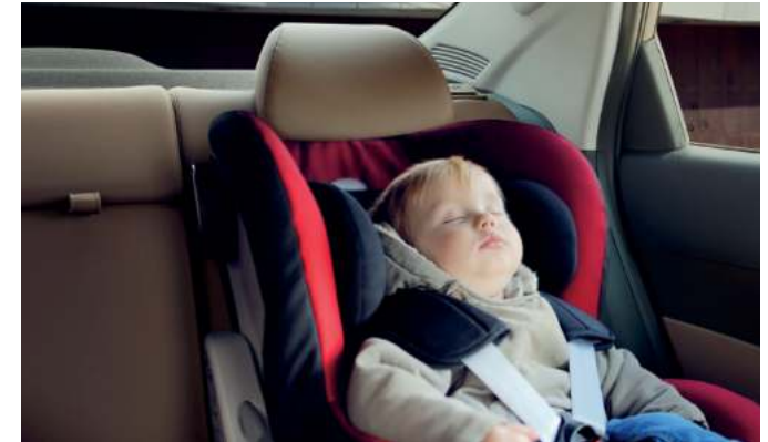
Sistema de anclaje para silla de niños ISOFIX