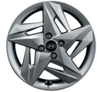
Aros de aleación 15"