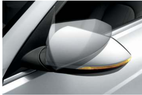
Intermitentes LED (OPT)