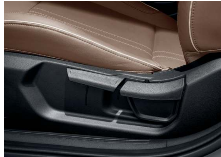
Regulador de altura del asiento del conductor

Pliegue los respaldos de los asientos traseros para crear más espacio de carga. Dispone de serie de reposacabezas ajustables y anclaje para asientos infantiles.