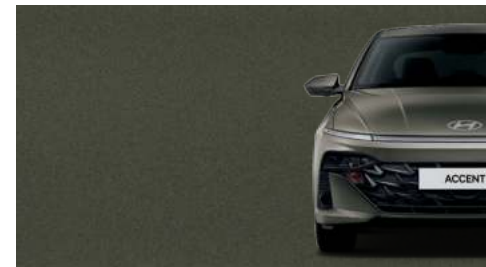
Marrón Telúrico Perlado_TBP