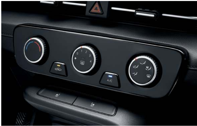
Aire acondicionado manual