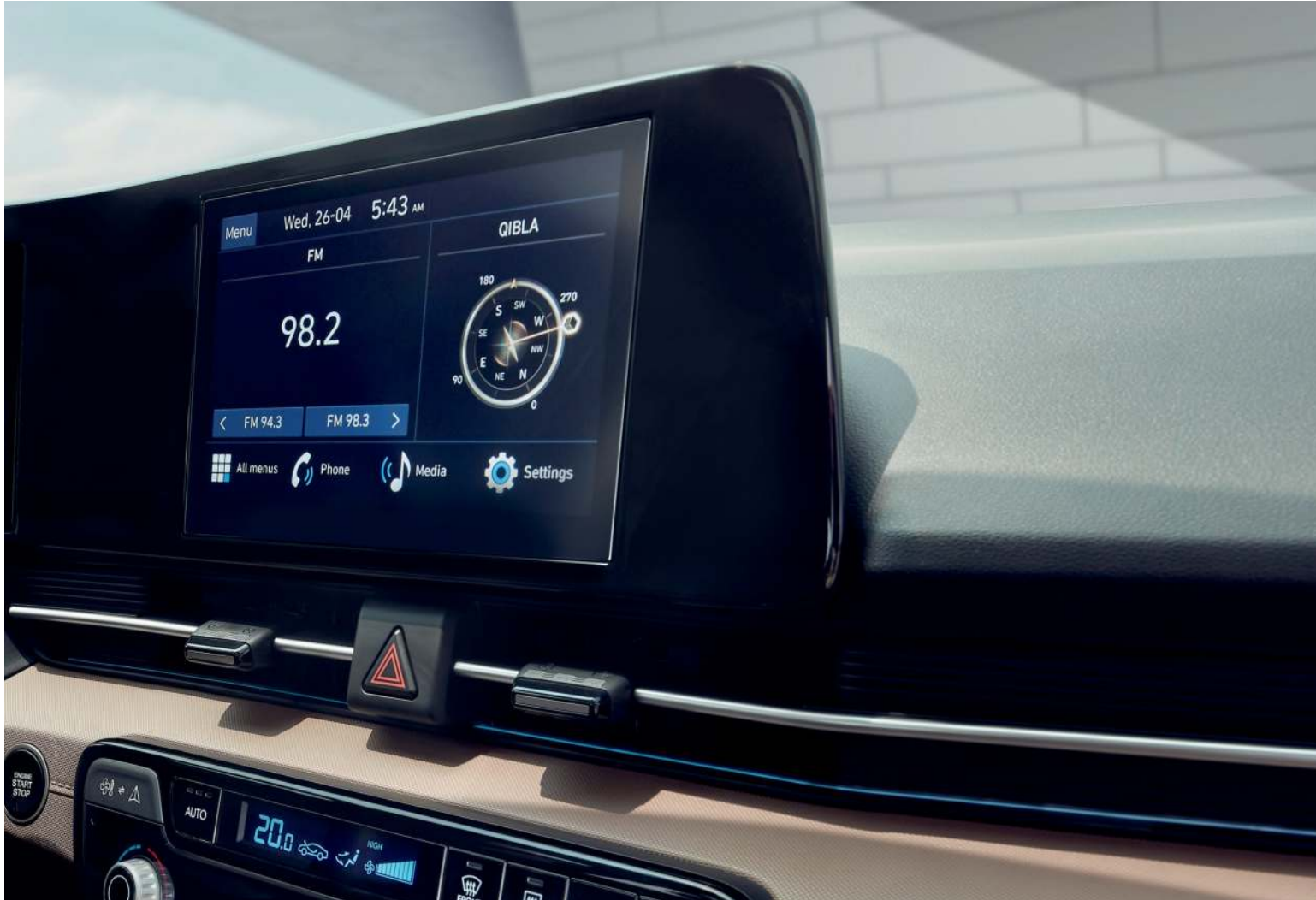
Pantalla táctil 9" Android Auto / Apple Car play

El nuevo Accent abraza la era virtual con pantallas digitales de gran nitidez que ofrecen una gran cantidad de información útil. Descubra deliciosas sorpresas como un sistema de control multimedia de 9 pulgadas, luces de ambiente y un sistema de sonido Bose.