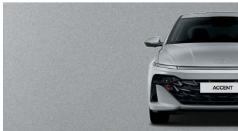
Plata Tifón Metálica_T2X