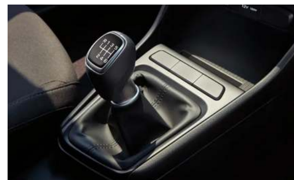
Transmisión Manual 6 velocidades más reversa