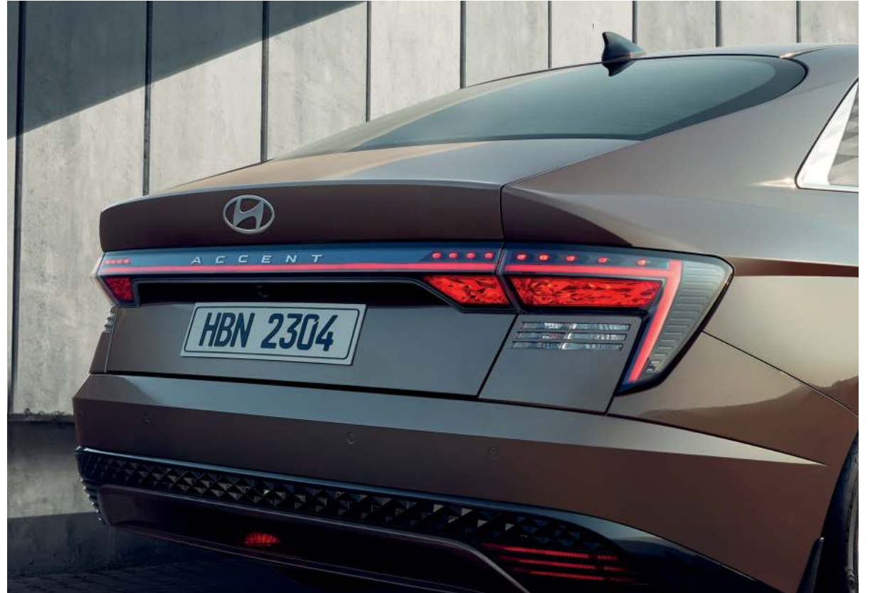
Luces LED traseras combinadas