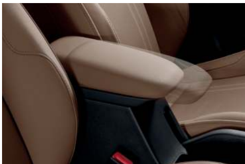
Caja de consola deslizable