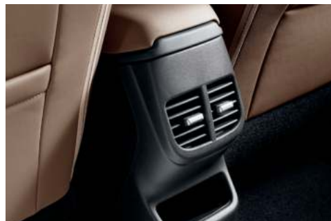
Ventilación en la parte trasera