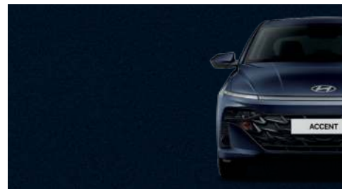
Azul Medianoche Perlado_UB7