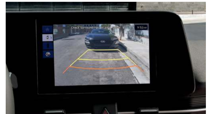
Monitor de visión trasera (RVM)

Para aparcar con más seguridad, una cámara de alta definición supervisa la situación por detrás e incluye una superposición gráfica para ayudar a estacionar.