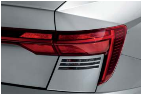
Luces combinadas traseras (tipo bombilla)