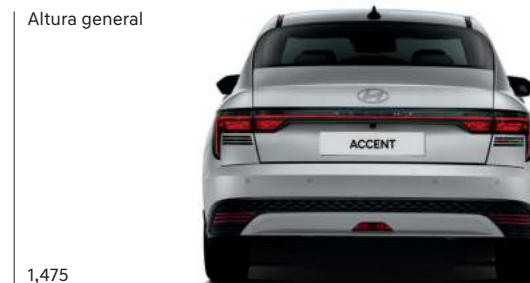
Altura general 1,475