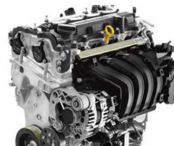
Motor Tipo G4FIII 1.5 MPI (Gamma2 1.5 MPI)