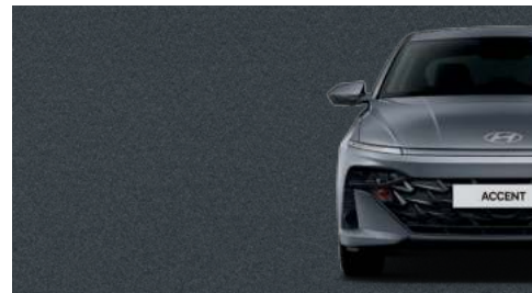
Gris Titán Metálico_R4G