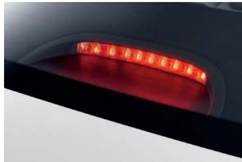
Faro de freno alto