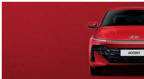
Rojo Ardiente Perlado_R4R