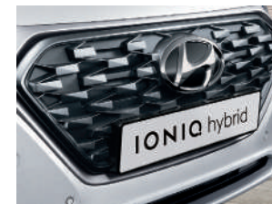
Parrilla tipo malla