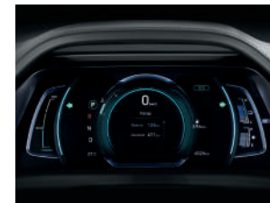
Panel de supervisión con pantalla a color LCD de 4,2 "