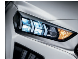
Faros delanteros LED