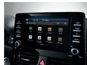
Pantalla táctil de 8" con Apple Car Play® / Android Auto + cámara de reversa